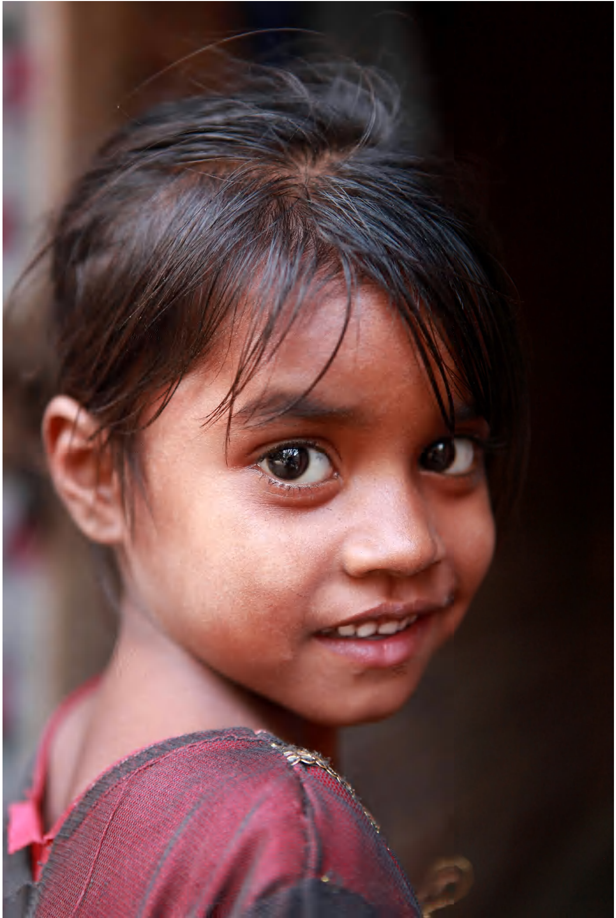
5 éves indiai kislány, arcán a leprabetegség árukkodó jelével