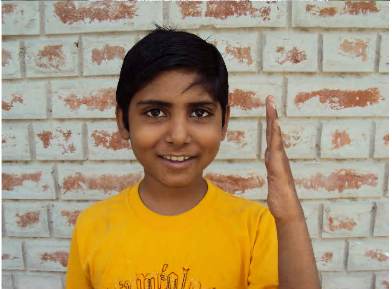
A kisiú lepra miatt meggörbült és használhatatlan kezét a műtét teljesen kiegyenesítette!