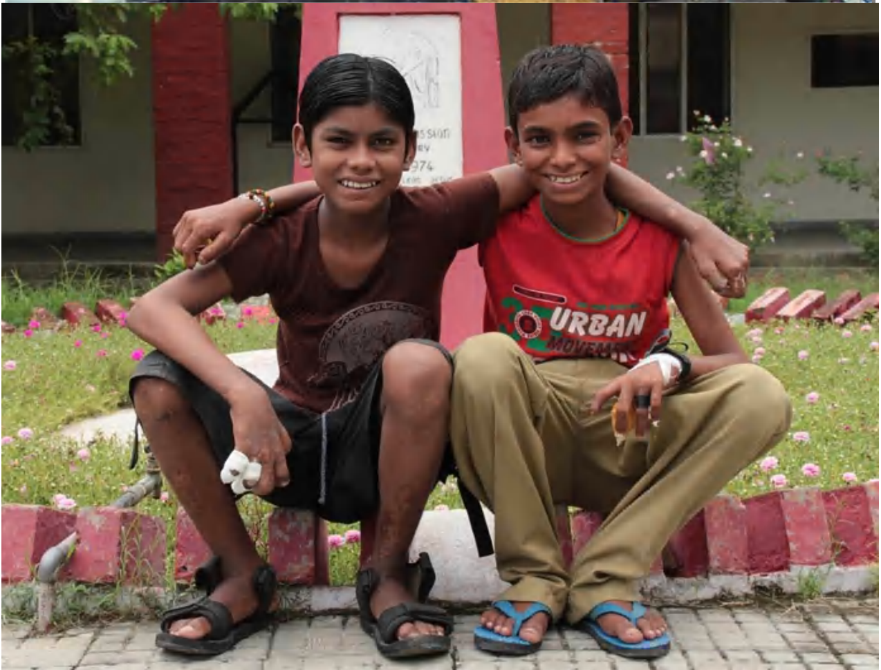
Avdes elkeserítő állapotban került a Lepramisszió egyik kórházába. Már néhány hét után is csodálatos változás történt rajta a gyógykezelés eredményeként!