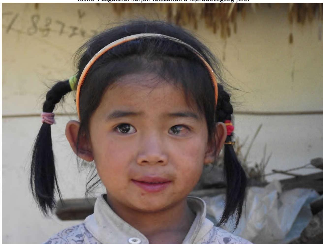
A kínai kislánynak a szemét támadta meg a leprabetegség kórokozója